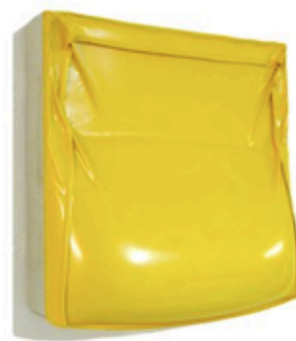
PHILIPPE ZUMSTEIN Fat Painting, Yellow , 2004 25 x 25 x 6 cm

La Laleh June Galerie a été fondée par Laleh June en 2008. Elle se trouve sur la Picassoplatz, en plein centre de Bâle. Son objectif principal est de proposer un lieu dédié à l'art contemporain suisse et international ainsi qu'à promouvoir, représenter et inviter des artistes. Depuis, elle a organisé des expositions historiques présentant les travaux de peinture, dessin, photographie, sculpture,