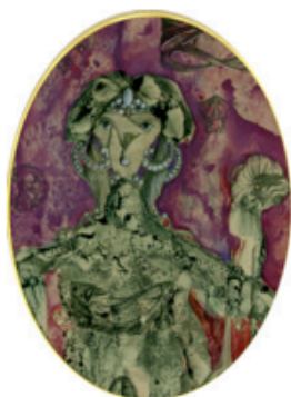
CHRISTIAN D'ORGEIX L'Eve Future , 1949 gouache on paper signed and dated left recto 22 x 16.5 cm / 8.6 x 6.4 in Upcoming solo exhibition with the artist at Laleh June Galerie: November 2017

Du 1er septembre au 28 octobre la vie est rose à la Laleh June Galerie à Bâle.