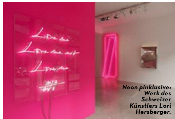
Neon pinklusive: Werk des Schweizer Künstlers Lori Hersberger.

• Laleh June Galerie, Basel, bis 28.10.; lalahjune.com