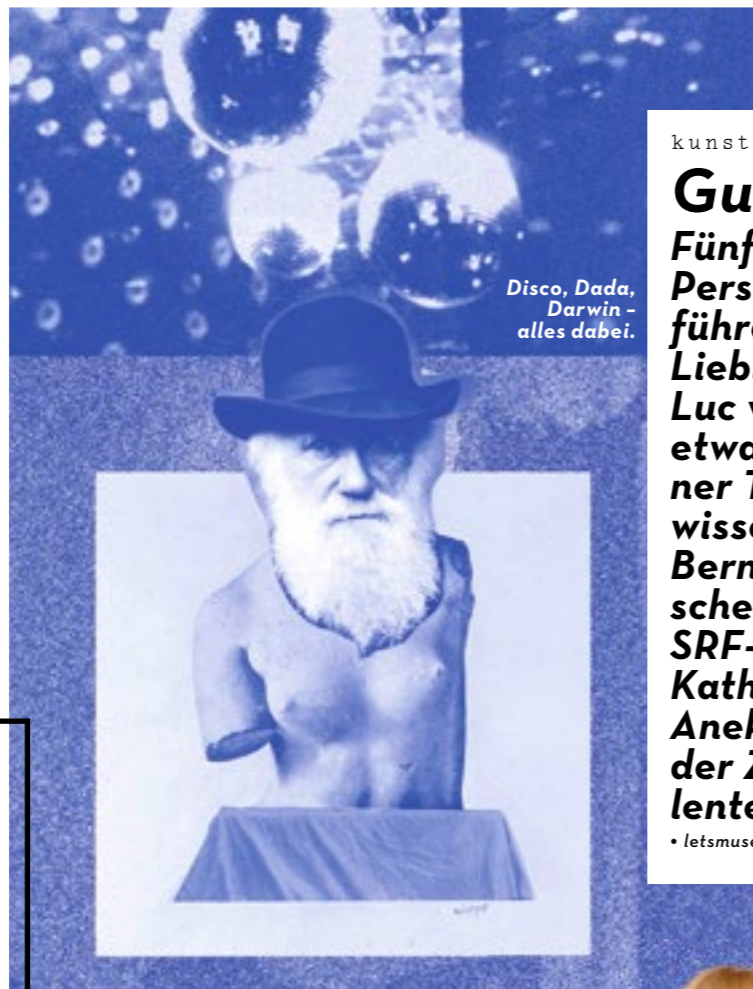
Disco, Dada, Darwin – alles dabei.